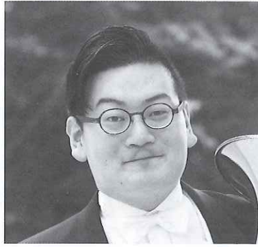
第20回コンセル・マロニエ21 金管部門 第1位

これまでに、国立音楽大学国内外研修奨学金、同大学2・3年次に最優秀にて岡田九郎記念奨学金、国際ロータリー財団国際親善奨学金、アンドレアス財団奨学金を取得。ピアノを内川裕子、近藤伸子、御木本澄子、角野裕、ガブリエル・タッキーノ、クラウス・ヘルゲビの各氏に師事。