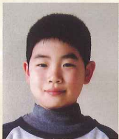
第10回栃木県ジュニアピアノコンクール 小学校1・2年生の部 最優秀賞