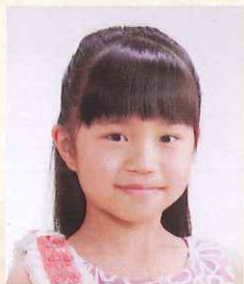
第10回栃木県ジュニアピアノコンクール 小学校3・4年生の部 最優秀賞