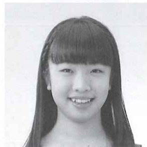
第10回栃木県ジュニアピアノコンクール 小学校5・6年生の部 最優秀賞