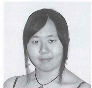
第10回栃木県ジュニアピアノコンクール 高校生の部 最優秀賞