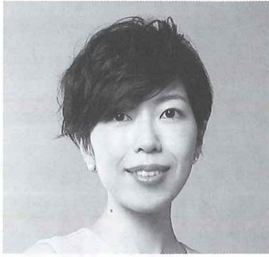
第20回コンセル・マロニエ21 ピアノ部門 第1位