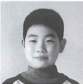
第10回栃木県ジュニアピアノコンクール 小学校1・2年生の部 最優秀賞

◆「コンセル・マロニエ21」は、未来に飛翔する新進音楽家に発表の機会を提供し、今後の活躍を奨励する音楽コンクールです。 ◆「栃木県ジュニアピアノコンクール」は、県内でピアノを学ぶ子供たちの感性と演奏技術を育むコンクールです。