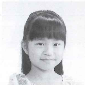
第10回栃木県ジュニアピアノコンクール 小学校3・4年生の部 最優秀賞

2007年 宇都宮市生まれ。 2014年4月 ヤマハ音楽教室 幼児科2年修了。 同年 5月 ヤマハ音楽教室 ジュニア専門コースへ進級。 現在、同コース2年に在籍。 第10回 栃木県ジュニアピアノコンクール 小学校1・2年生の部 最優秀賞。