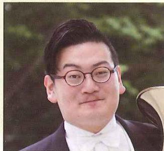
第20回コンセール・マロニエ21 金管部門 第1位