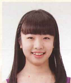
第10回栃木県ジュニアピアノコンクール 小学校5・6年生の部 最優秀賞