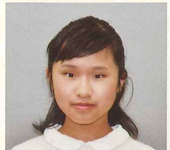
第10回栃木県 ジュニアピアノコンクール 大賞