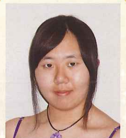
第10回栃木県ジュニアピアノコンクール 高校生の部 最優秀賞