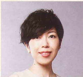
第20回コンセール・マロニエ21 ピアノ部門 第1位

～音楽文化の振興・発展を願って開催するクラシック音楽コンクール “コンセール・マロニエ21”と“栃木県ジュニアピアノコンクール”の入賞者たち～