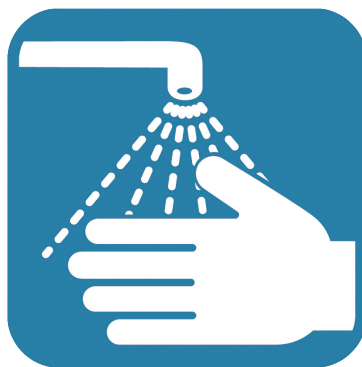
手洗い、手指の消毒