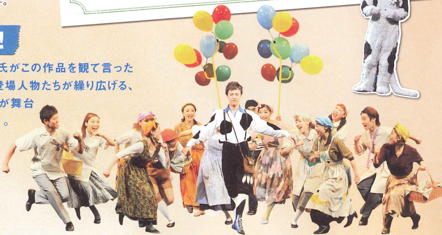
写真はこれまでの公演より

「魔法のように魅惑的!」・・・それは原作ロイド・アリグザンダー氏がこの作品を観て言った言葉です。作者をも虜にしてしまうその魅力とは・・・。愛すべき登場人物たちが繰り広げる、躍動感いっぱいのダンス。心に訴えかける歌の数々。そしてここが舞台だということを忘れさせてしまうリアルでダイナミックなセット・・・。それらがすべて物語の力をしっかりと引き立て、人間の素晴らしさ、命や仲間の大切さを伝えてくれるのです。観終わったとき、皆さんの心には、明るく生きていこうという思いがあふれてくるでしょう。ダンスターの森とブライトフォードの町ではじまる、夢と感動の物語。さあ、あなたもライオネルと一緒に、新しい世界で冒険してみましょう！