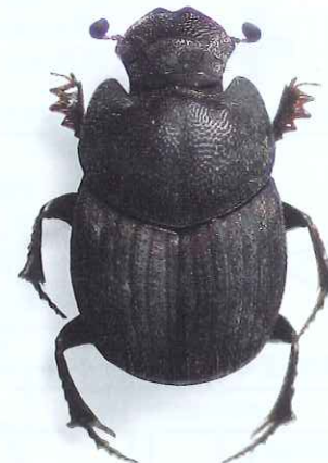
ニッコウコエマコガネ