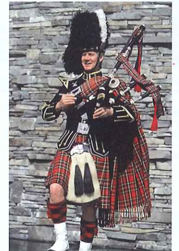
ジェラルド・ミューヘッド

ジェラルド・ミューヘッドの 「イギリスを愉しむ〜レクチャー付き バグパイプコンサート」 10月21日