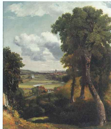
ジョン・コンスタブル 《デタムの谷》