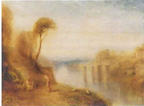
J.M.W. ターナー 《風景・タンバリンをもつ女》

19世紀イギリス風景画の二大巨匠、ターナーとコンスタブルの作品を中心に、イギリス美術を特集します。