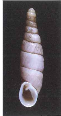
チュウゼンジギセル