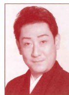
なかむら し かん 中村芝翫