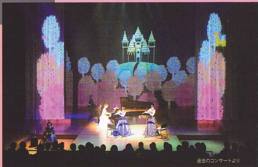
過去のコンサートより