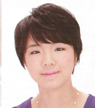
第18回コンセール・マロニエ21 ピアノ部門 第1位