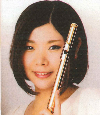
第18回コンセール・マロニエ21 木管部門 第1位